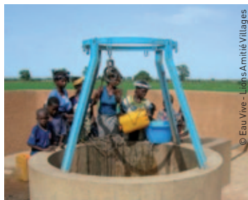
© Eau Vive - Lions Amitié Villages